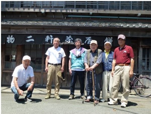
川の駅・二軒茶屋 > 餅が名物