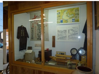
伊勢・神社(かみやしろ)港 海の駅「みなとまち館」 NPO神社みなとまち再生 グループが運営。