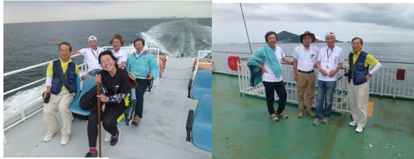
船上(高速船→フェリー)にて。

■河和港～伊良湖港～鳥羽港＞伊勢・勢田川を木造船「みずき」で古(いにしえ)の舟参宮 + NPO神社(かみやしろ)みなとまち再生グループと交流 / 2019. 6. 5(水)-6. 6(木)