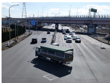
・臨港道路への入口