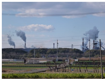
・ようやく臨海部を再見