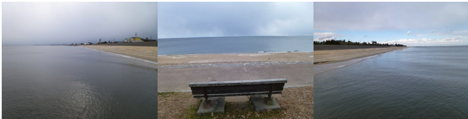
・・・ いちばん伊勢湾らしいと感じた風景 千代崎海岸 ・・・