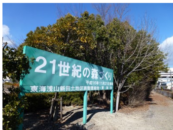
・東海市の取り組み