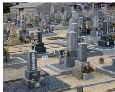
・伊勢湾に向かって 穏やかに眠る日々