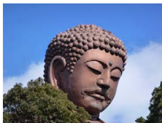
・聚楽園駅から帰ろうと思ったけど「もう少し歩け」といわれたようで