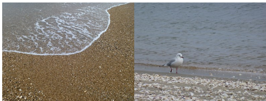
・豊かな伊勢湾を残そう