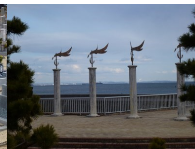
・伊勢湾はこちらです