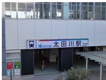
・14km コンビニもなし。 ようやく昼めし