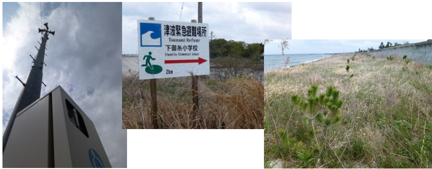
・防災対策を見ると、歩いていても安心する。