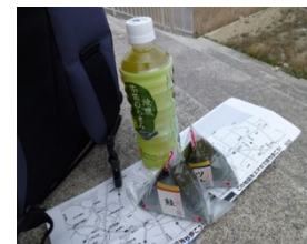
・今日も伊勢湾を見ながらベントー