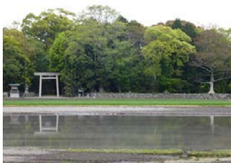
・今から浜を歩きますので。