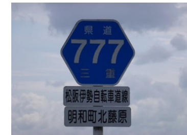
・こういう数字が好きな人もいると思ひまして。