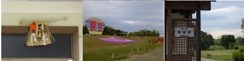
・いよいよ伊勢が近づいてきた。