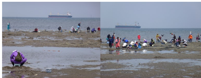
・松名瀬海岸 潮干狩り風景