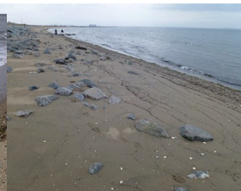
・だんだんと岩が出てきた。